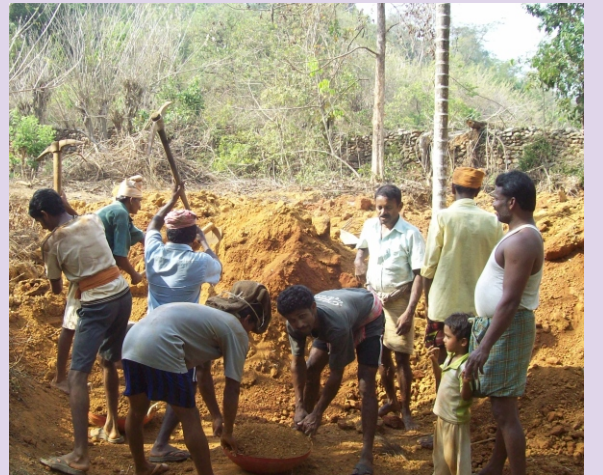
ಕಾಮಗಾರಿ ಸ್ಥಳದಲ್ಲಿ ಕೆಲಸದಲ್ಲಿ ನಿರತರಾದ ಕೂಲಿಕಾರರ ಚೊತೆ ಫಲಾನುಭವಿ