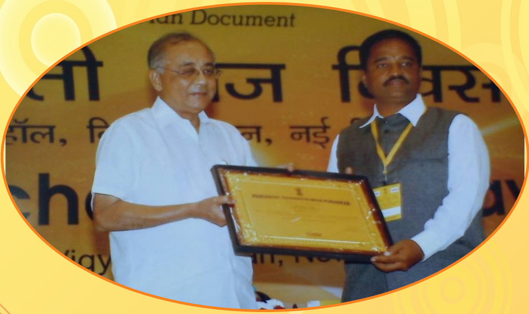
ಕೇಂದ್ರ ಪಂಚಾಯತ್ ರಾಜ್ ಸಚಿವರಿಂದ ಶಿವಮೊಗ್ಗ ಜಿಲ್ಲೆ, ಶಿವಮೊಗ್ಗ ತಾಲ್ಲೂಕು ಪಂಚಾಯತಿ ಅಧ್ಯಕ್ಷರು ಪ್ರಶಸ್ತಿ ಸ್ವೀಕರಿಸುತ್ತಿರುವುದು.