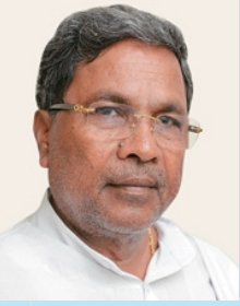
ಸಿದ್ದರಾಮಯ್ಯ ಸನ್ಮಾನ್ಯ ಮುಖ್ಯಮಂತ್ರಿಗಳು

ಮಾನ್ಯ ಶ್ರೀ ಸಿದ್ದರಾಮಯ್ಯನವರು ಮೈಸೂರು ತಾಲ್ಲೂಕಿನ ವರುಣಾ ಹೋಬಳಿಯ ಸಿದ್ದರಾಮನ ಹುಂಡಿ ಗ್ರಾಮದಲ್ಲಿ ಸಿದ್ದರಾಮೇಗೌಡ ಹಾಗೂ ಬೋರಮ್ಮ ದಂಪತಿಗಳ ಮಗನಾಗಿ 1948ರ ಆಗಸ್ಟ್ 12 ರಂದು ಜನಿಸಿದರು.