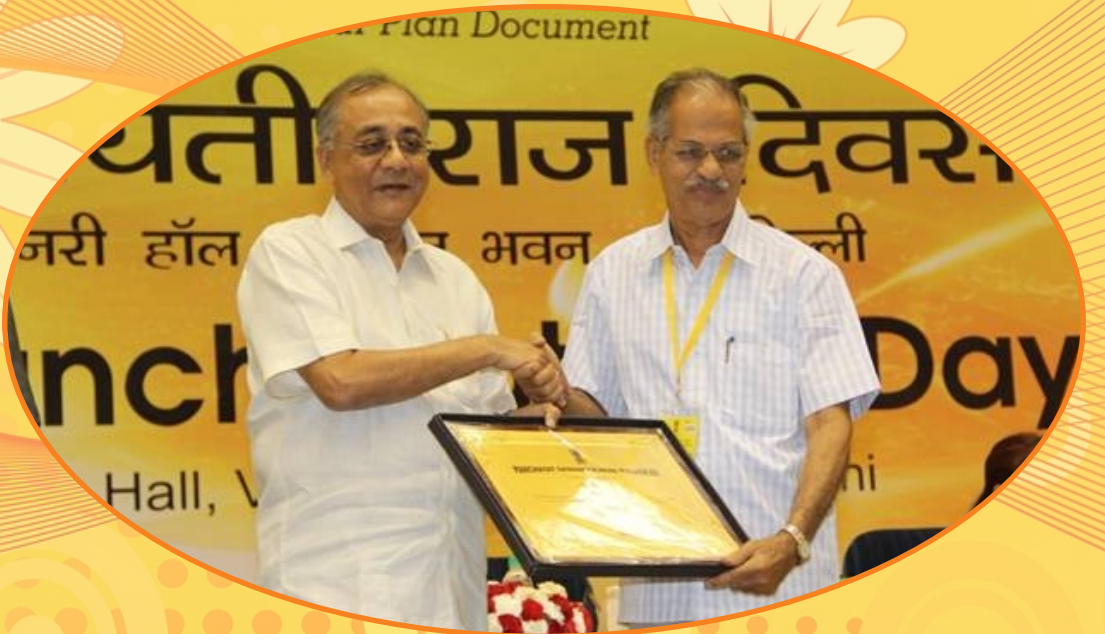
ಕೇಂದ್ರ ಪಂಚಾಯತ್ ರಾಜ್ ಸಚಿವರಿಂದ ಉಡುಪಿ ಜಿಲ್ಲೆ, ಕುಂದಾಪುರ ತಾಲ್ಲೂಕಿನ ಮರವಂತೆ ಗ್ರಾಮ ಪಂಚಾಯತಿ ಅಧ್ಯಕ್ಷರು ಪ್ರಶಸ್ತಿ ಸ್ವೀಕರಿಸುತ್ತಿರುವುದು.